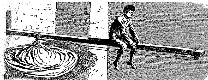
Ἐίδε τὸν φίλον του καθήμενον ἐπὶ τῆς δοκοῦ, ὑπεράνω τῆς ἀβύσσου! (Σελ. 221, στ. 6)