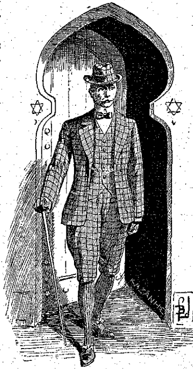
Ἡ βαρβατα θύρα ἠνοίχθη... (Σελ. 222, στ. 6)

Καὶ βέβαια ἐξοχα! ὑπέλαβεν ὁ σπουδαστῆς, ὑπερήφανος — καὶ μετὰ τὸ δίκη του — διὰ τὸ κατόρθωμά.