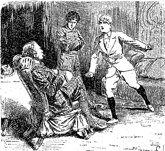
"Θά μου κόψετε λοιπόν τώρα ταυτία;..." (Σελ. 223, στ. α')

— Μ' αυτό το σπαγάμι, κατακτώ έγω τον Κατακτητή!