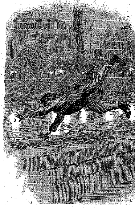
«Και από εκεί μπλούμ! στον Σηκουάνα!...» (Σελ. 216, στ. γ')

—Τό σχεδίο μας ήτον άπλούστατο, άρχηγέ, απεκρίθη ο Έρβελίν. Θ' άφίναμε, ο Δυβάλ κ' εγώ, τους κακούργους να κλέ