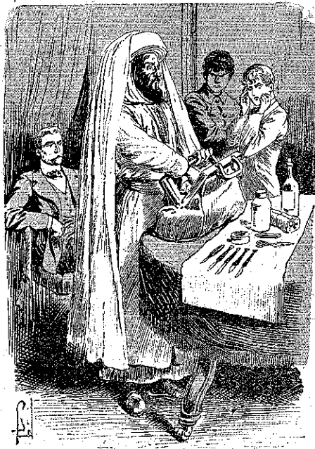
"Ο ιατρός άδειαζεν επάνω εις τό τραπέζι ένα σάκχον..."

— Άκριβώς! απεκρίθη ό κ. Δίκ. Το παιδί έχει καλλίτερην μνήμην από σένα, Τζούλη. Ένθυμηταί ότι τρεις ήμέρας πρό του τέλους του μηνός, εάν δεν ελάμβανα άπάντησιν από τόν κ. Ρισανέλ; θά ήμουν ύποχρεωμένος δια να τού υπενθυμίσω τό χρέος του και να τού δείξω ότι δεν έχει να κάμθ με κανένα κοινόν έκβιαστήν, να τού στείλω, με μεγάλην μου λύπην και με ειδικόν ταχυδρόμον, τ' αυτία του υίου του.